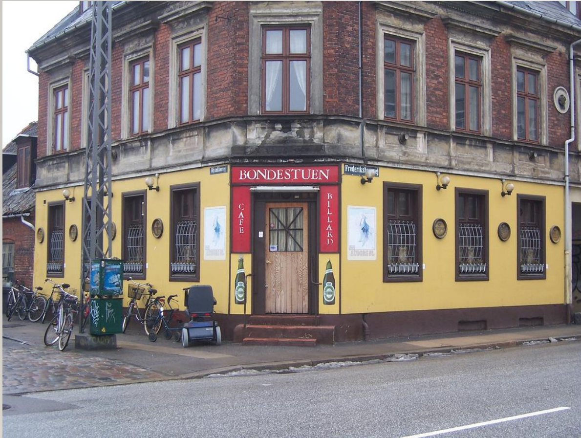
Blytækkervej/Frederiksborgvej: Fra Bondestuen til Miklagård